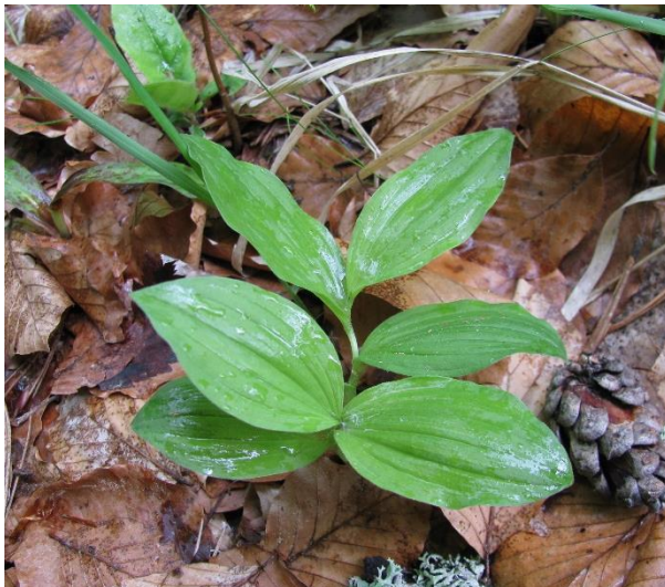
Девинска планина. Екземпляр във вегетативно състояние. Автор: И. Герасимова