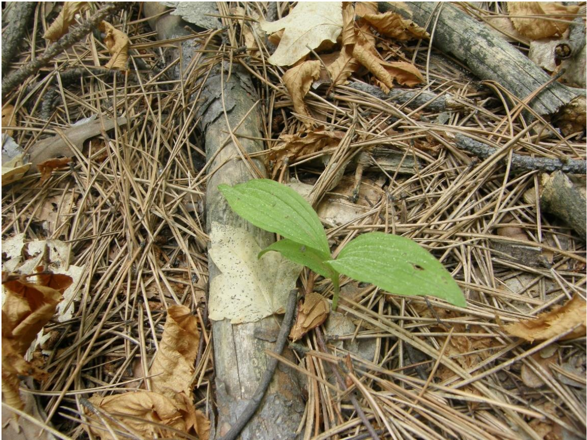
Добростански масив. Екземпляр с единичен стрък, във вегетативно състояние. Юни 2012 г.