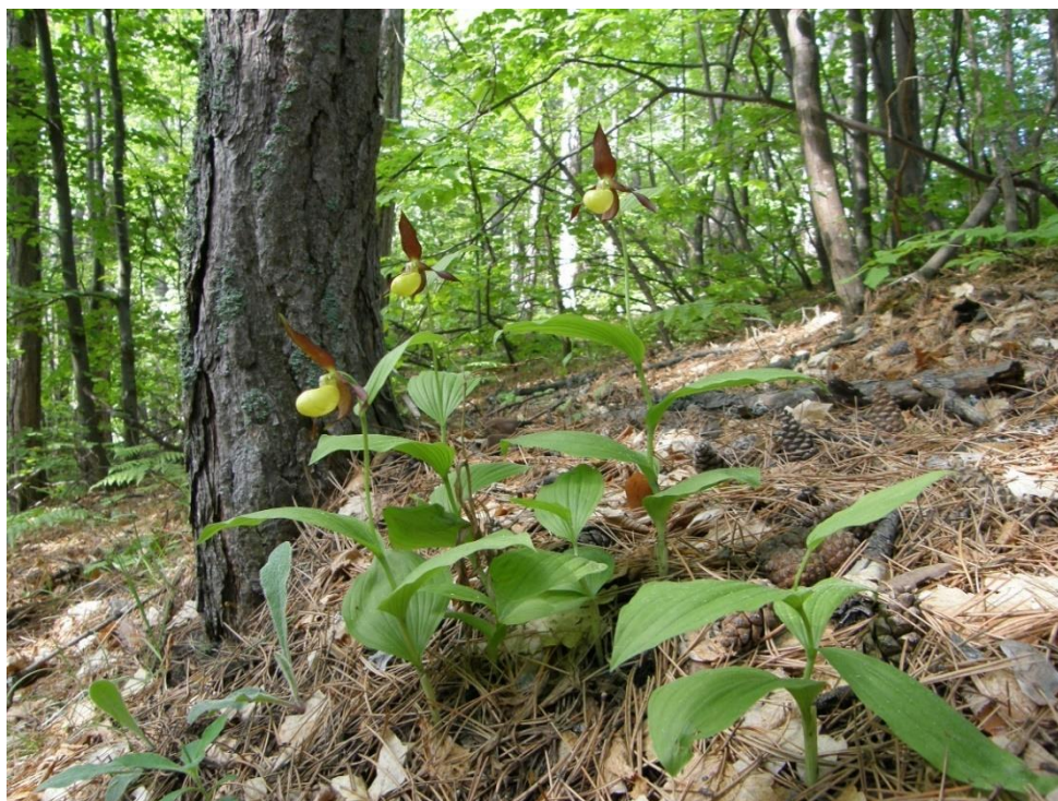
Добростански масив. Най-едрият екземпляр в популацията. Цъфтеж. Юни 2014 г.