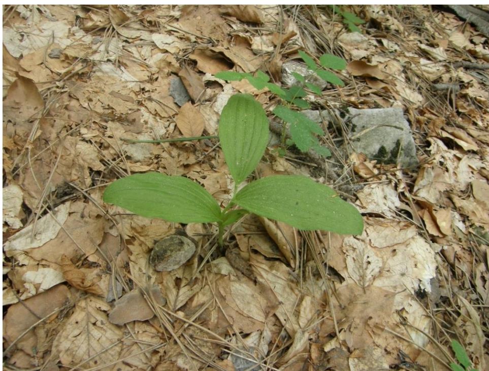
Добростански масив. Екземпляр с единичен стрък, във вегетативно състояние. Юни 2012 г. Автор: А. Петрова.