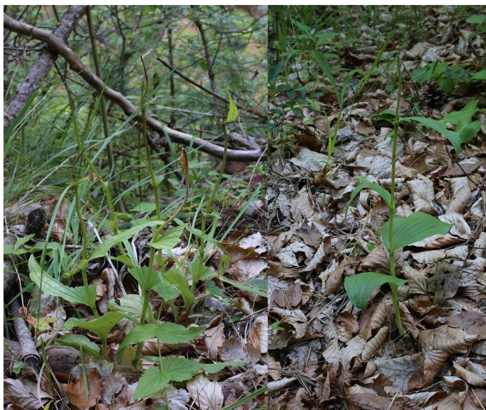
Изядени от охлюви (или насекоми) растения. Девинска планина, 07.2016 г. Автор: И. Костадинов.