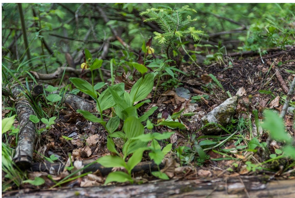
Девинска планина. Утъпкване от фотограф в непосредствена близост до индивида. Май 2018 г.