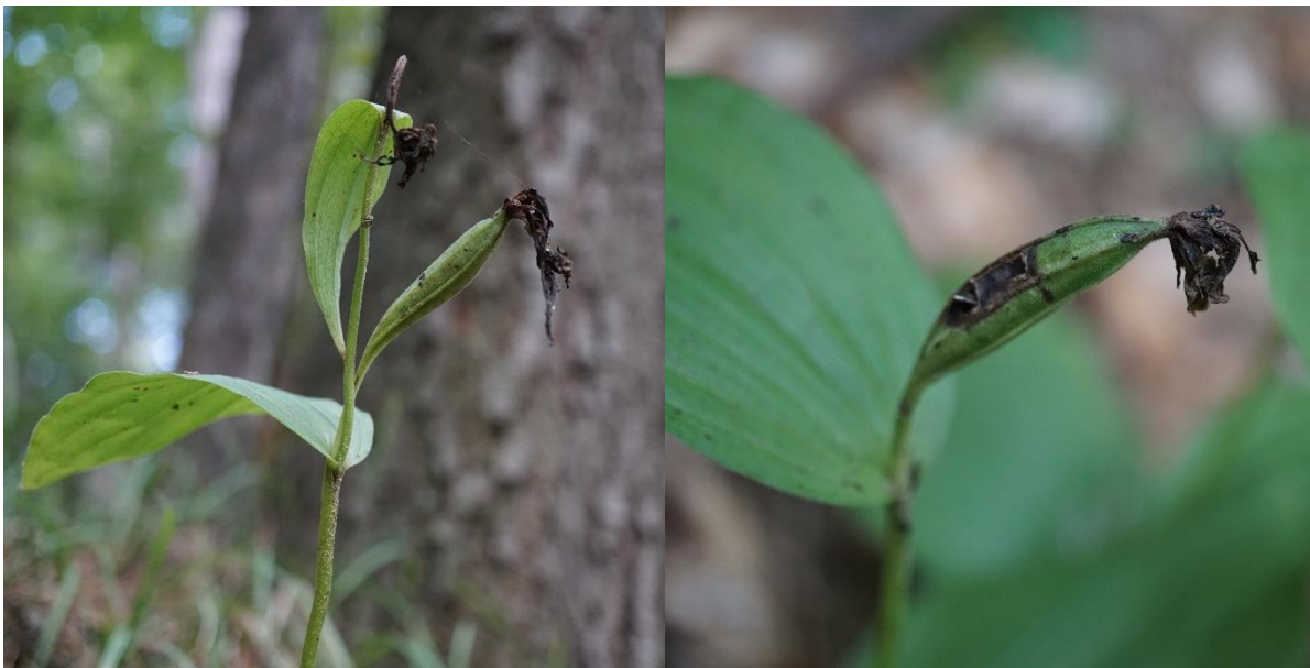
Добростански масив. Плодни кутийки, септември 2021 г. Автор: Р. Василев.