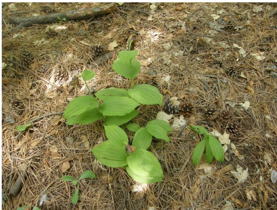
Добростански масив. Най-едрият екземпляр в популацията. Край на цъфтежа. Юни 2012 г.