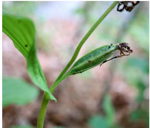
Девинска планина. Плодна кутийка, септември 2021 г. Автор: Р. Василев.